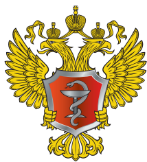
Министерство здравоохранения РФ

Не растерявшись в экстренной ситуации и правильно оказав первую помощь, вы спасете ребенку жизнь!